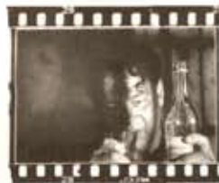
Armand Lohikosken ohjaama Takaisin yhteiskuntaan -filmin viesti on yhä ajankohtainen.