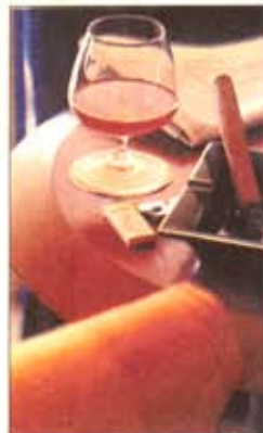
Konjakkia antoi pikarentoutuksen.

seen. Olin usein hermostunut tai masentunut."